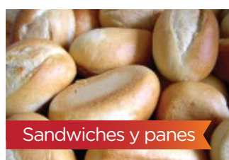
Sandwiches y panes