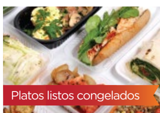
Platos listos congelados